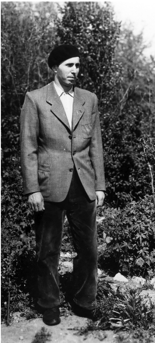
Foto nach der Selbstbefreiung des KZ Buchenwald, Archiv DZOK Rep. 1 603 – 2686

Aus: Fritz Kaspar, Die Schicksale der Gruppe G , Nachdruck 1985