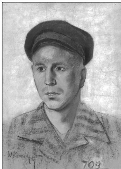
Porträt aus dem KZ Dachau, gemalt von dem polnischen Mithäftling W. Kowalski, Stadtarchiv Stuttgart 2127, FM 64-9

Im Jahre 1960 erschienen die Erinnerungen von ihm und seinen Freunden als Buch „Die Schicksale der Gruppe G“ in der DDR. 1985 organisierte Hans persönlich einen Reprint des Buches, bevor im Jahre 1994 eine aktualisierte Neufassung unter dem Titel